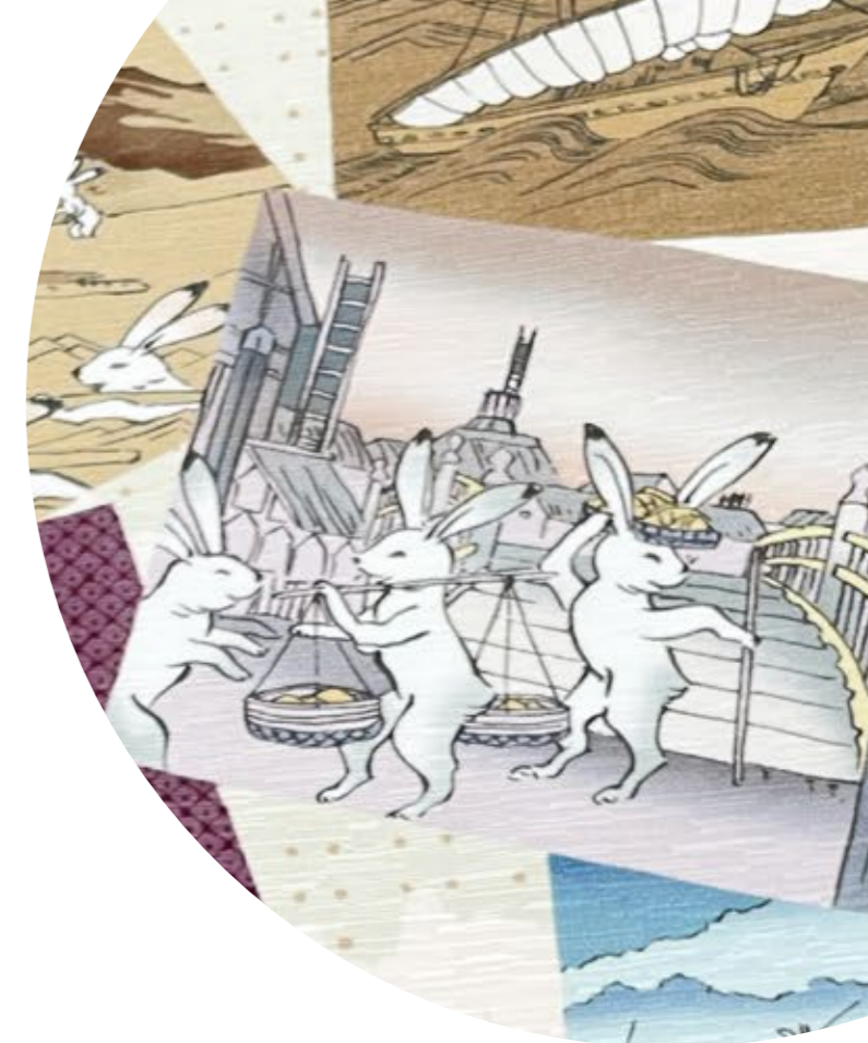
ウサギ達が行く WA・KKA版東海道五十三次 細かなところも 見どころ満載